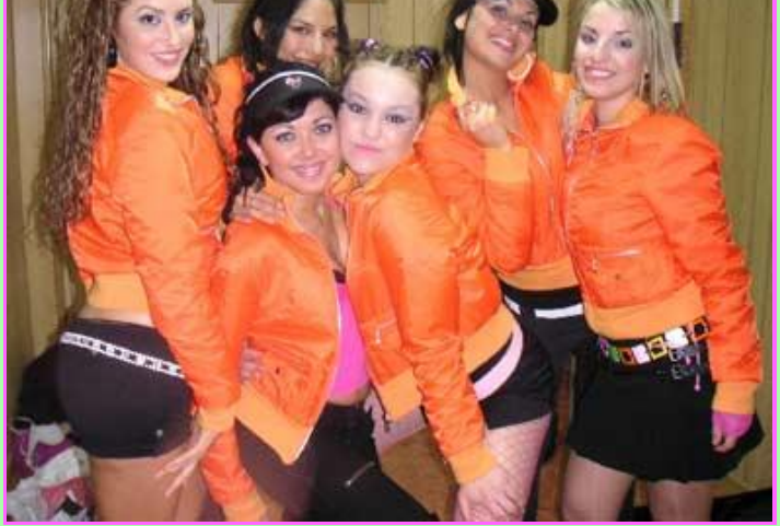
La trata de blancas encubierta como Girlband es muy moda

6) Magnolias de Acero: Es otro de los grupos surgidos de la perversa mente de Antonio Fontaneda, porque a quién sino a él se le puede ocurrir la idea de unir a exconcursantes que nadie recuerda de "Popstars: Todo por un sueño" con exconcursantes de un programa que nadie recuerda ("Estudio de actores"). El resultado, un grupo bigger than life, con más capacidad succionadora que chicas sin novio tenía Papá Levante por metro cuadrado. Sacaron un disco que está a 1 euro en "La metralleta". Me pregunto en qué puticlub andarán metidas y si las de "Estudio de actores" habrán superado el trauma de estar encerradas en un reality que nadie veía, ni los cámaras.